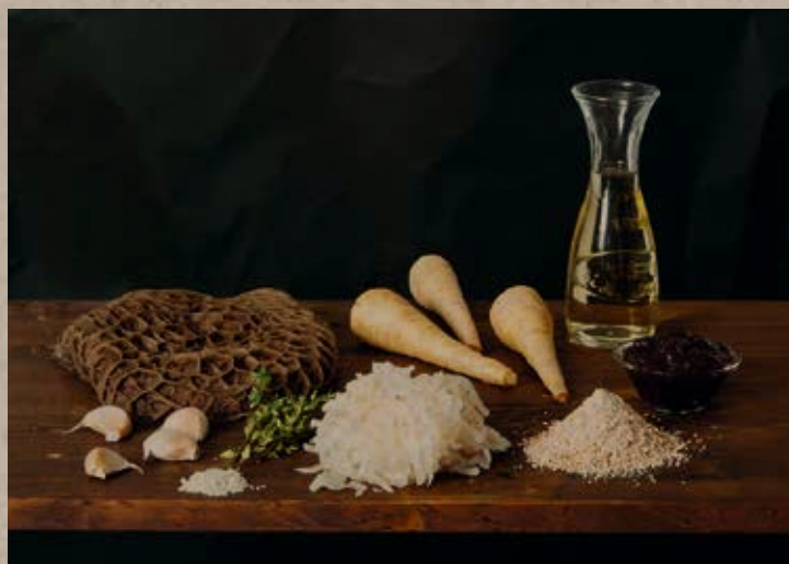
Hunger war im Mittelalter – und noch Jahrhunderte danach – für die meisten Menschen eine ständige Bedrohung. Man war froh, wenn man genug zu essen hatte. Viel Abwechslung gab es nicht.