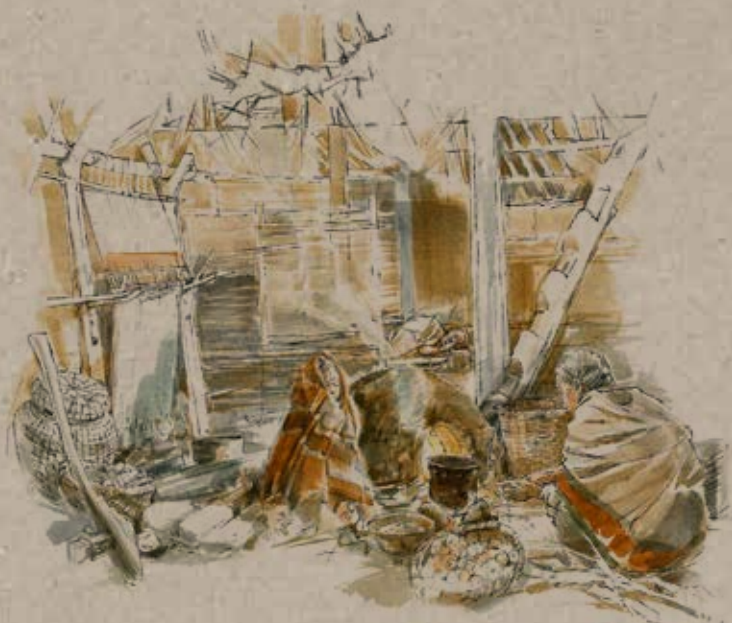
Am Burgäschisee im Herbst 3830 v. Chr. Minara kauert am Herd. Im Topf köchelt eine Suppe. (Illustration: Benoit Clarys)

Doch wie ass man früher, vor hunderterten und tausenden von Jahren? Das Archäologische Museum Solothurn hat sich auf die Suche gemacht. Es hat Spuren gefunden von eiszeitlichen Jägern, steinzeitlichen Bäuerinnen, wohlhabenden Keltinnen, römischen Müllerknechten, mittelalterlichen Stadtbewohnerinnen – und einer modernen Familie.